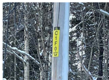
Adresse électrique du poteau

En effet, si vous êtes témoin d'un tel événement, il faut que vous sachiez qu'il ne faut jamais prendre pour acquis que le courant a été coupé, car souvent ce n'est pas le cas et le courant peut être sournois et imprévisible.