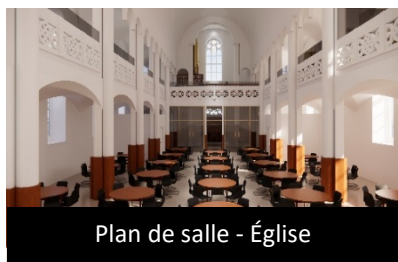
Plan de salle - Église

D'un autre ordre d'idées, mais tout aussi pertinent dans les démarches municipales, le projet de transformation de l'église en salle multifonctionnelle s'est poursuivi en 2025. Plusieurs rencontres de suivi avec l'architecte ont eu lieu et la Municipalité a finalement reçu les plans finaux que nous révisons et vérifions jusqu'au lancement de l'appel d'offres prévu en janvier 2026. Toutefois, deux corvées bénévoles ont eu lieu pour retirer tous les bancs d'église et les mettre en vente ainsi que pour poser et solidifier le plancher de bois. Ces tâches fastidieuses ont été réalisées bénévolement et auront permis de réduire le coût du projet en main d'œuvre pour un montant variant entre 50 000 $ et 60 000 $.