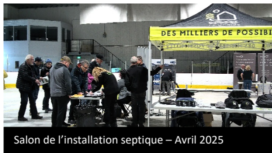
Salon de l'installation septique – Avril 2025

de l'installation septique de la MRC de Portneuf afin d'informer davantage les propriétaires sur les démarches à entreprendre et offrir l'opportunité d'aller à la rencontre des entrepreneurs qui ont répondu présents à l'événement. Nous avons donc accueilli le 12 avril dernier ce salon dans le Centre récréatif ESU; un événement couronné de succès grâce à votre présence en grand nombre!