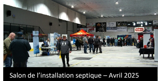
Salon de l'installation septique – Avril 2025

Les propriétaires de l'an 1 du programme ont reçu en début d'année leur rapport de caractérisation donnant l'état de leur installation septique selon les critères évalués par la firme d'expertise. Comme plusieurs rapports d'expertise de l'an 1 mentionnaient la nécessité de faire une intervention ou de remplacer leur installation septique, la Municipalité a préparé la tenue du 2e Salon