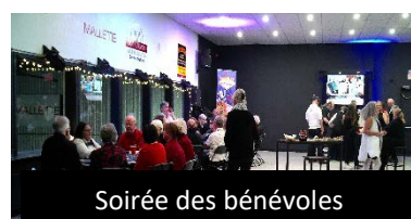
Soirée des bénévoles

Les nombreux bénévoles qui gravitent autour des événements qu'on vous propose font une différence notoire dans la tenue de ceux-ci. Sans eux, nous n'y arriverions pas et nous sommes reconnaissants de leur implication! C'est pourquoi la Municipalité a tenu à célébrer leur contribution et leur