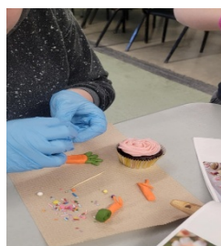
Atelier décoration de cupcakes

Les activités sportives et culturelles présentées à la population pour la saison hivernale, mais également lors de la semaine de relâche et la saison printemps-été 2025 étaient, pour notre part, diversifiées offrant davantage de propositions abordables pour les jeunes du primaire en activités parascolaires ainsi que pour tous les âges. Bref, d'année en année, on bonifie la programmation offerte sachant pertinemment que ce ne seront pas tous les cours qui pourront débuter en raison du nombre de jeunes sur notre territoire. L'important pour nous, c'est de vous offrir de la variété! Nous recherchons en continue des personnes passionnées à partager leurs connaissances avec autrui pour offrir des ateliers ou des cours à Saint-