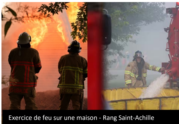
Exercice de feu sur une maison - Rang Saint-Achille

Autre nouveauté, un comité de sécurité civile a été créé et les membres se sont réunis environ cinq (5) fois au cours de l'année afin de préparer des trousse de survie en cas de sinistre qui sont entreposés dans la caserne. Soyez rassurés, votre Service incendie est là et sera là s'il advenait un sinistre important sur notre territoire!