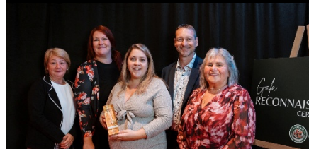
Gala de reconnaissance Certifiée Régie – Septembre 2025

D'un autre ordre d'idées, mais tout aussi pertinent dans les démarches municipales, le projet de transformation de l'église en salle multifonctionnelle s'est poursuivi en 2025. Plusieurs rencontres de suivi avec l'architecte ont eu lieu et la Municipalité a finalement reçu les plans finaux que nous révisons et vérifions jusqu'au lancement de l'appel d'offres prévu en janvier 2026. Toutefois, deux corvées bénévoles ont eu lieu pour retirer tous les bancs d'église et les mettre en vente ainsi que pour poser et solidifier le plancher de bois. Ces tâches fastidieuses ont été réalisées bénévolement et auront permis de réduire le coût du projet en main d'œuvre pour un montant variant entre 50 000 $ et 60 000 $.