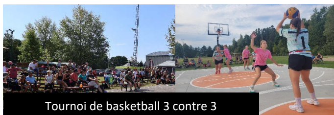
Tournoi de basketball 3 contre 3

Cette année, le Service des loisirs en collaboration avec les propriétaires de GameTime Basketball a tenu le 1 er tournoi de basketball 3 contre 3 à Saint-Ubalde dans le Parc des Générations inaugurant par la même