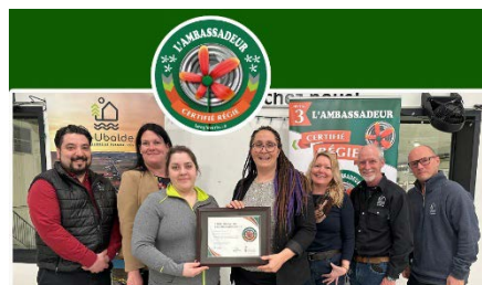
Remise de la certification Ambassadeur

La Municipalité a adhéré au programme Certifiée Régie de la Régie régionale de gestion des matières résiduelles de Portneuf qui se veut une initiative afin d'optimiser notre gestion des matières résiduelles et favoriser des pratiques durables et responsables avec l'accompagnement personnalisé de la Régie. La Municipalité s'est vue attribuée la certification « Ambassadeur » à l'issue de cette démarche. Tous les récipiendaires arborant de bonnes pratiques écoresponsables à travers la MRC de Portneuf se sont vus honorés lors d'un gala de reconnaissance en septembre dernier.