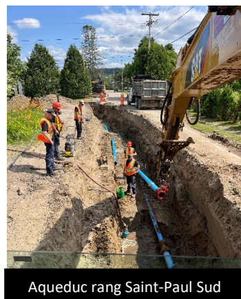
Aqueduc rang Saint-Paul Sud

Un des plus gros chantiers de l'équipe a été effectué sur une partie du rang Saint-Paul Sud et le rang Saint-Georges. Les travaux, financés entièrement par le programme TECQ 2024-2028 consistaient à prolonger le réseau d'aqueduc jusqu'à la limite du réseau privé en provenance du rang Saint-Joseph afin d'améliorer le niveau de pression d'eau des résidents du secteur déjà collectés qui nous informaient à répétition des baisses de pression dans leurs résidences.